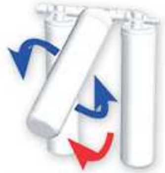
クイックチェンジ フィルター